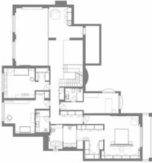
Birinci Kat Planı / First Floor Plan