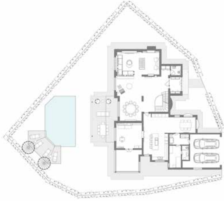
Zemin Kat Planı / Ground Floor Plan