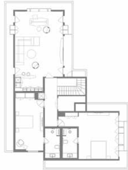
Çatı Katı Planı / Attic Plan