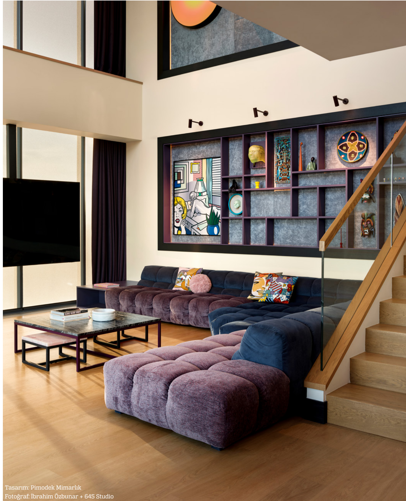
Tasarım: Pimodek Mimarlık